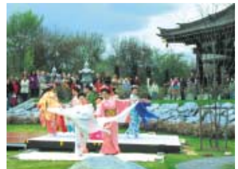
Japanische Tempelanlage (EKO-Haus)