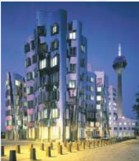
Gehry-Bauten im MedienHafen