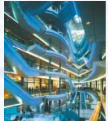
Sevens (Kaufhaus an der Königsallee)