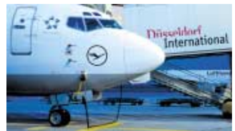
Flughafen Düsseldorf International